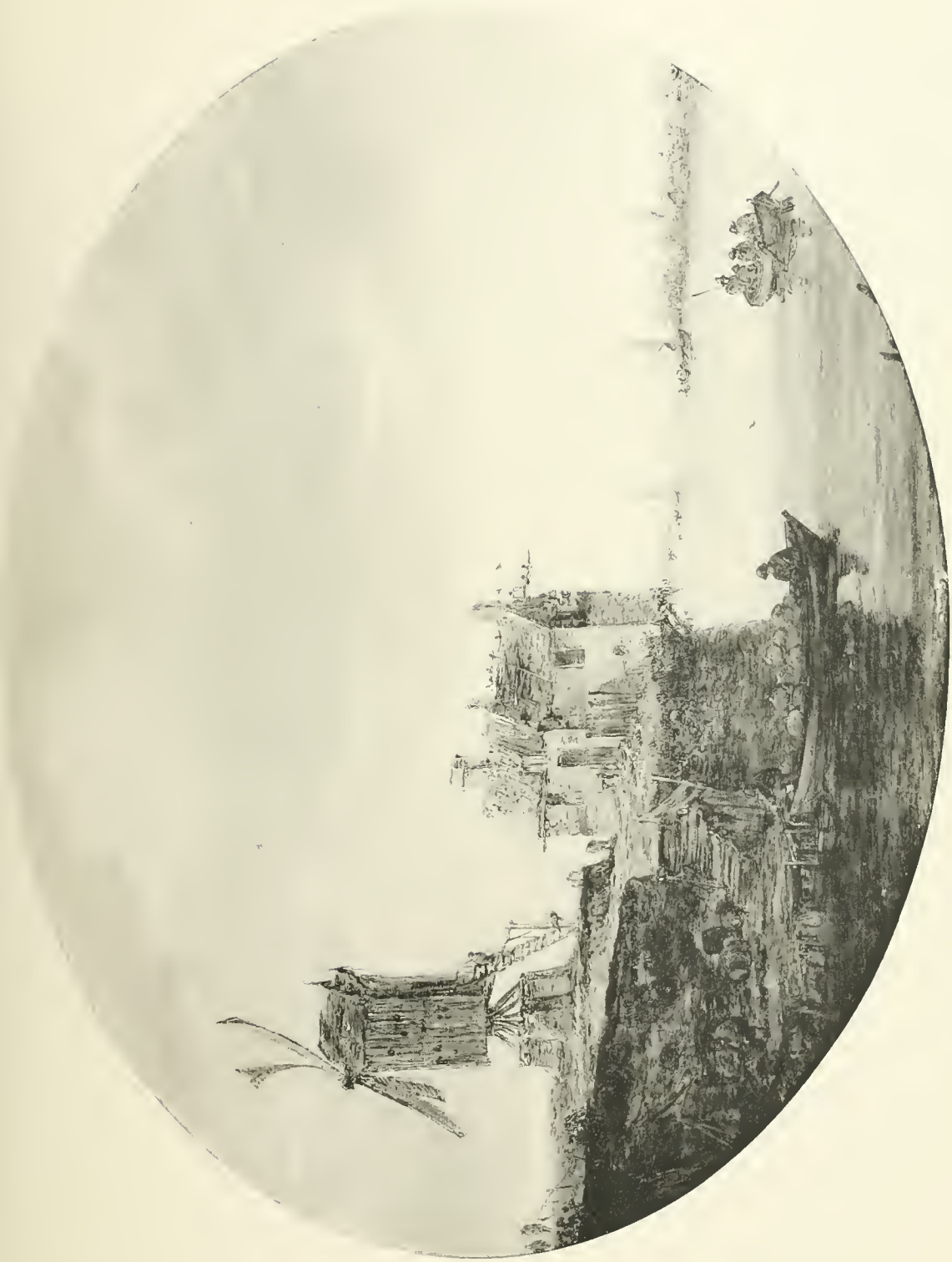
J. VAN GOYEN